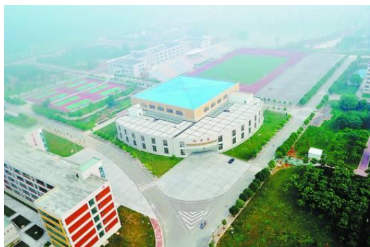
育人条件一流的现代化校园

馆建设经验，继续针对行业实际，优化建筑技术馆文化建设，大力弘扬优秀传统文化，推进先进文化传播。同时，不断挖掘和弘扬自身特色校园文化，引进工业文化、企业文化、职业文化进校园，使多元文化更多地融入到特色校园文化中，提升学生职业素养，培养学生创新意识，增强学生发展后劲，促进学生成长成才。