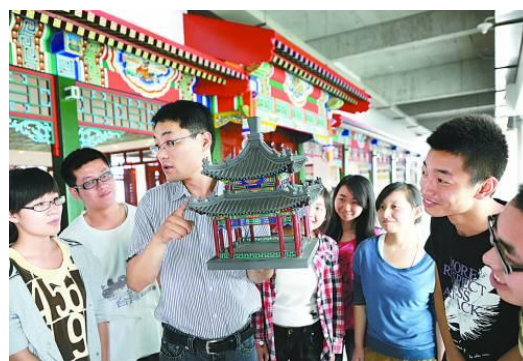
学生在中国古建筑实训室近距离感受中国古建筑和谐结构、精美彩绘之美