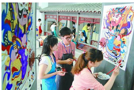
学生在进行建筑壁画创作实训