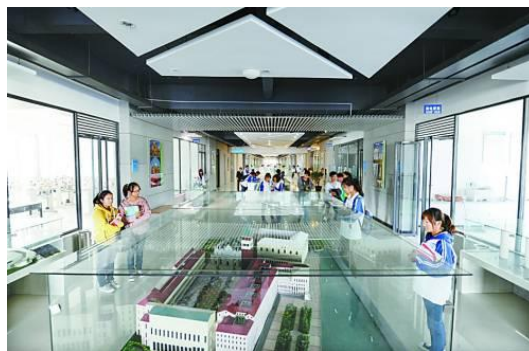
在建筑技术馆文化长廊可以感受建筑文化的艺术、智慧之美